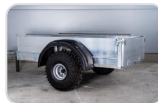
Kotflügel Kunststoff 1-achsig