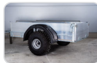
Kotflügel Kunststoff 1-achsig