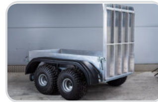
Rampenöffnung hinten mit Schienen

Höhe 350 mm € 660,- Höhe 550 mm € 930,- Höhe 750 mm € 1.200,-