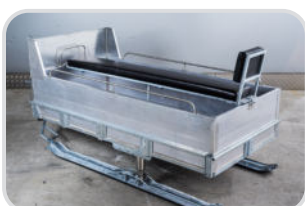
Aufbau für Personentransport („Sitzbank“) mittig mit Rückenlehne hinten, Haltegriff vorne, sowie Haltestangen seitlich