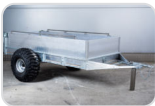
Reling/Zurrgurt-Schiene auf Bordwand