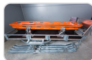
Korbtrage FERNO F71 einteilig