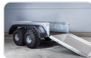
Kotflügel Kunststoff 2-achsig