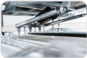
Schneebremse mit Bedienung am Lenker (inkl. Verkabelung Motorschlitten) € 2.450,-