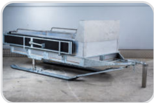
Sitzbank seitlich verstaubar (nur bei Ski möglich) € 210,-

Wir gehen auf Ihre individuellen Wünsche ein.