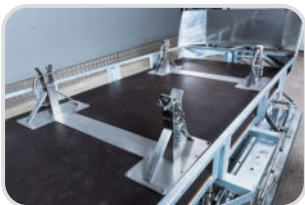
Edelstahl-Aufbau für Verletzentransport inkl. FERNO-Korbtrage € 2.115,-