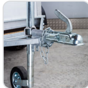
Pfanne (statt Öse) für Anhänger-Kugel € 140,-