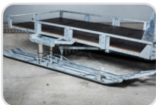
Spurverbreiterung € 390,-