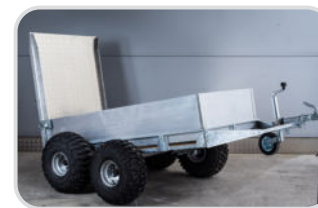
Ballonräder 2-achsig (Pendelachse)