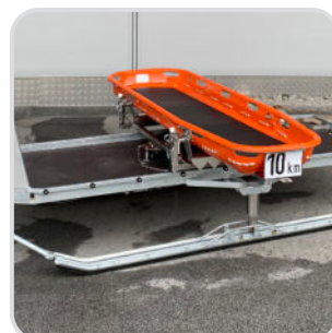
Drehkranz mit Edelstahl-Aufbau für beige stellte Korbtrage € 8.685,-