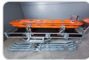
Korbtrage FERNO F71 einteilig