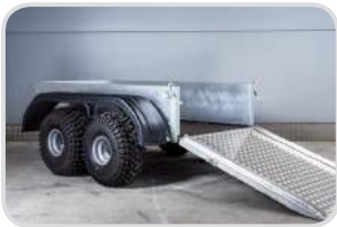
Kotflügel Kunststoff 2-achsig

Wir gehen auf Ihre individuellen Wünsche ein.