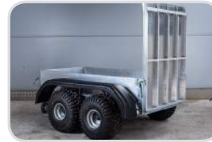
Rampenöffnung hinten mit Schienen

Höhe 370 mm € 295,- Höhe 570 mm € 335,- Höhe 770 mm € 375,-