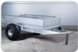
Reling/Zurrgurt-Schiene auf Bordwand