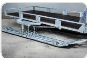
Verbreiterung auf 2 Ski