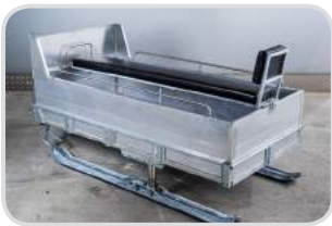
Aufbau für Personentransport („Bierbank“) mittig mit Rückenlehne hinten, Haltegriff vorne, sowie Haltestangen seitlich