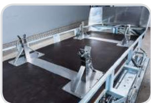
Edelstahl-Aufbau für Verletztentransport inkl. FERNO-Korbtrage

(Verkabelung an weiteren Motorschlitten € 329,-)