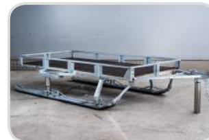
Ski mit 2 fixen Formrohrstützen und beweglicher Deichsel