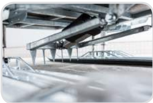
Schneebremse mit Bedienung am Lenker (inkl. Verkabelung Motorschlitten)