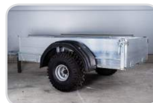
Kotflügel Kunststoff 1-achsig