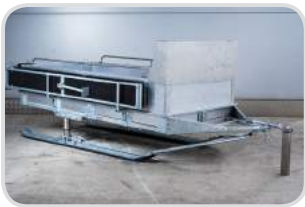
„Bierbank“ seitlich verstaubar (nur bei Ski möglich)