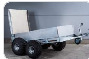
Ballonräder 2-achsig (Pendelachse)