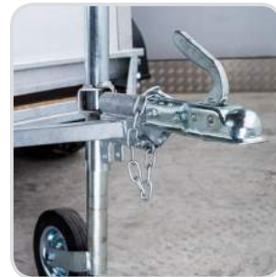
Pfanne (statt Öse) für Anhänger-Kugel